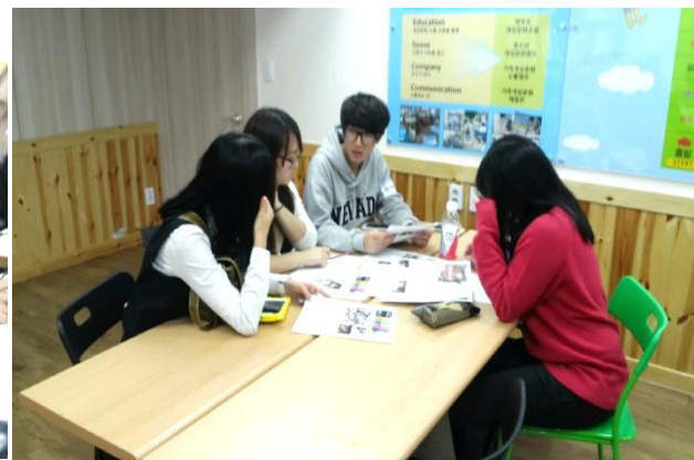
▲ 사전모임 진행