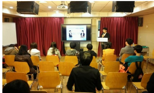
◀ 기자토크콘서트 진행