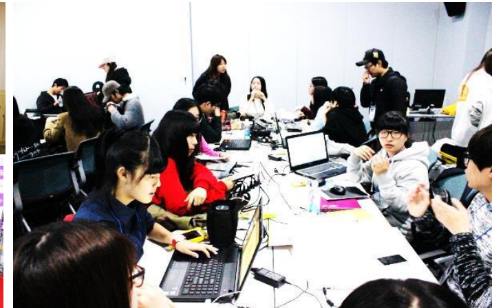
▲ 공동취재 진행