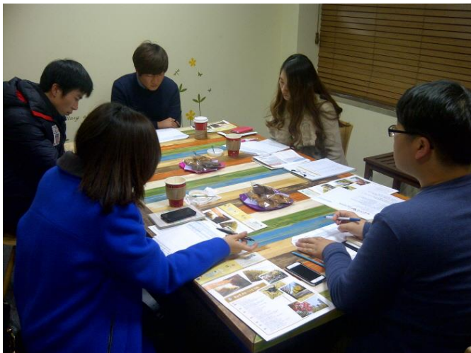
▲ 기자단 지도자 회의